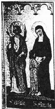
1698 300 1998 rokov od príchodu Sestier Uršulínok

Gymnázium ako jediné trnavské gymnázium poskytuje študentkám dochádzajúcim zo vzdialenejších miest ubytovanie v domove mládeže, ktorý sa nachádza v areáli školy. Posilovňa slúži ako jedna z možností relaxácie po náročnom štúdiu. Škola nadviazala styky i s mimoslovenskými gymnáziami v Nemecku v meste Eisenach a vo Francúzsku v meste Nantes. Škola mala dlhoročné problémy s vyučovacím priestorom. Minulý rok sestry uršulínky získali naspäť budovu v ktorej sídlilo štátne gymnázium. Tým sa uvoľnili priestory pre